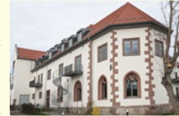
Kapitelhaus, jetzt Teil einer Wohnanlage

In der südöstlichen Ecke des Konventbaus befindet sich das nach Osten ausgerichtete damalige Kapitelhaus mit dem Kapitelsaal im Erdgeschoss. Der Kapitelsaal war der Versammlungsraum aller Chorschwestern des Stifts (Konvent). Es ist ein sakral anmutender Raum mit polygonaler Apsis, in deren Mitte das große Echterwappen zu sehen ist. Hier hielt der Propst an herausgehobenen Tagen im Kirchenjahr vor dem versammelten Konvent Predigten. In diesem Raum wurden die jungen Frauen als Novizinnen eingekleidet und legten nach zweijährigem Noviziat ihr ewiges Gelübde ab (Profess). Der Kapitelsaal ist heute im Kreis Würzburg der einzige Raum mit originalem Echterstuck.