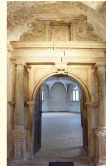
Portal zum Kapitelsaal

Ein 1614 vollendetes Renaissanceportal aus hiesigem Werksandstein des unteren Keuper ziert den Zugang zum Kapitelsaal. Vor dem Portal befindet sich ein restaurierter Abschnitt des damaligen Kreuzganges. Dort sind Grabsteine von Klosterfrauen aus dem 18. Jahrhundert ausgestellt, die auf dem überbauten Gelände des aufgelassenen Klosterfriedhofs gesichert werden konnten. Gegenüber dem Portal zum Kapitelsaal liegt der historische Küchenraum. Der Kapitelsaal, die Grabsteine und die historische Küche sind zu besonderen Anlässen zu besichtigen.