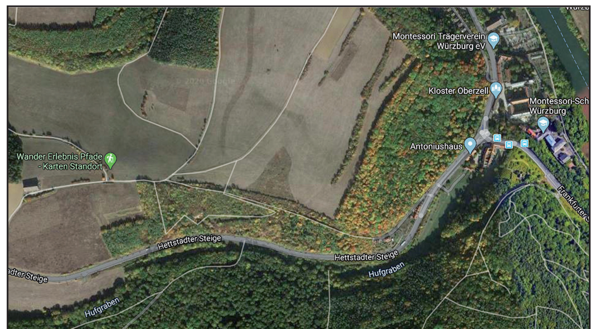
Luftaufnahme Hettstadter Steige