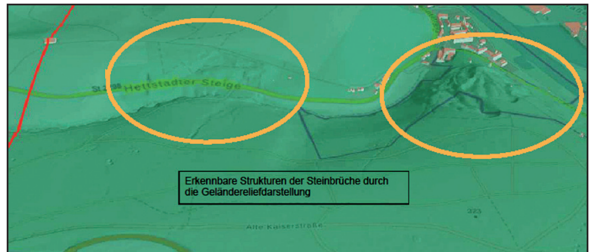
Geländereiefarstellung aus dem Bayernatlas, auf dem die Steinbrüche zu erkennen sind

Aussagekräftig ist dabei eine Geländereiefaufnahme, die im Bayernatlas eingesehen werden kann. Auf der dortigen Darstellung können deutlich die Strukturen des bisher bekannten Steinbruchs bei dem Gasthof „Zu den zwei guten Greifen“, dem jetzigen Antoniushaus (s. Nr. 10: Feldscheune ), und auf halber Höhe direkt an der Zeller Steige die eines weiteren großen Steinbruchs erkannt werden. Obwohl dieser genauso ausgedehnt ist wie der bisher bekannte am Talgrund beim Kloster, ist er in den bisher bekannten Karten nicht verzeichnet. Da er als Lieferant für die Klöster wahrscheinlich bereits im Mittelalter zumindest an Baumaterial weitgehend erschöpft war, ist er offensichtlich in Vergessenheit geraten. Bei diesem Steinbruch dürfte es sich um den in der Urkunde von 1360 genannten Steinbruch des Klosters an der cellersteyge handeln. Die Oberzeller Ziegelei mit ihren Kalkbrennöfen lag bezeichnender Weise genau in der Mitte zwischen diesen beiden Steinbrüchen (s. Nr. 3: Die Ziegelei an der Zeller Steige ).