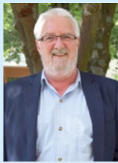
Erster Bürgermeister Joachim Kipke

Liebe Zeller Bürgerinnen und Bürger, ich freue mich, Ihnen mit dem Jahresrückblick 2022 eine kleine Auswahl der doch vielen Geschehnisse, die im Laufe des Jahres im Informationsmagazin „Zell aktuell“ veröffentlicht wurden, in Erinnerung zu rufen. Im ersten Halbjahr gab es noch viele Veranstaltungsabsagen wegen des Pandemiegeschehens. Doch nach und nach war wieder mehr erlaubt und es fanden zahlreiche, langersehnte Feste und Begegnungen statt. Das Jahr 2022 war aber auch durch die erschütternden Ereignisse in der Ukraine geprägt. Die Zellerinnen und Zeller zeigten und zeigen sich solidarisch und helfen, wo sie können. Die Maintalhalle wurde zur Erstaufnahmestelle, im Kloster Oberzell leben weiterhin zahlreiche Menschen aus der Ukraine. Neben der Corona-Pandemie und dem schrecklichen Krieg in Europa wurden uns 2022 auch ganz deutlich die Auswirkungen des Klimawandels vor Augen geführt. Die Natur lechzte nach Wasser und die große Trockenheit verursachte Brände – auch im Zeller Gemeindegebiet. Unsere Feuerwehr war ständig im Einsatz, wofür ich mich im Namen aller Bürgerinnen und Bürger herzlich bedanke! Danke auch für die vielen schönen Momente, die wir in unserer Dorfgemeinschaft im vergangenen Jahr erleben durften. Ich wünsche Ihnen viel Spaß beim Lesen und Erinnern!